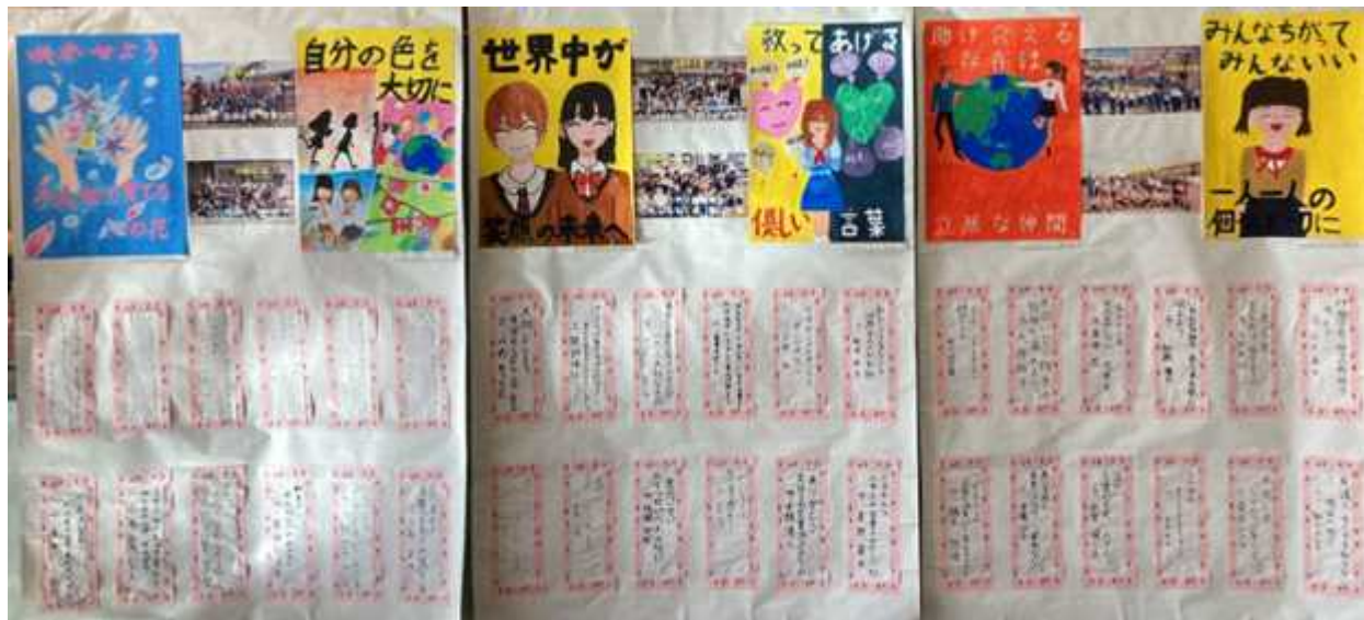
【大間々南小学校の代表作品の一部】

<期日>1月20日(金) ~ 2月2日(木) ※月曜日は休館日 <場所>笠懸公民館 2階ロビー