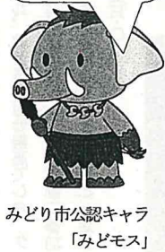
みどり市公認キャラ「みどモス」

カラフルな文字での「Dツクル回収場所」が目印です。校内には職員が運びます。外に置いていただければと思います。