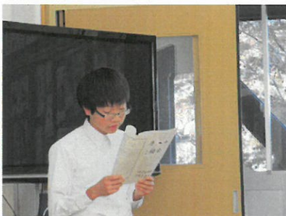
保健・給食委員会