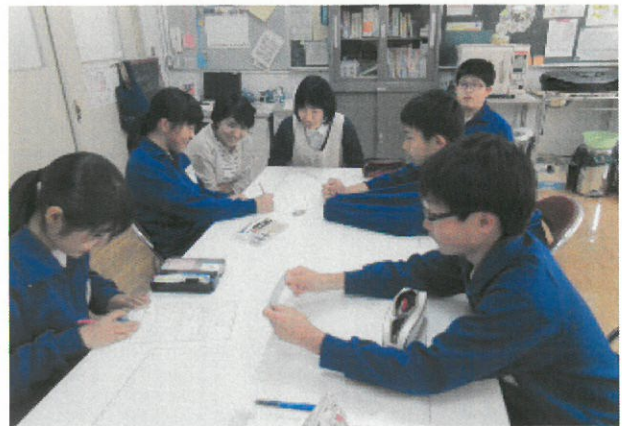
〈保健委員会・図書委員会〉