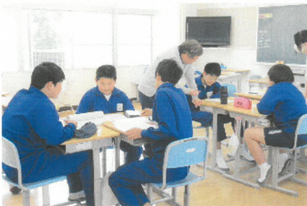
〈学級放送委員会・体育委員会〉